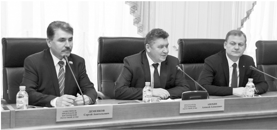
За год депутаты приняли полторы сотни законов

Компенсация за детские сады и медицинские кадры, поддержка пожилых людей и инвестиции - об этом и не только рассказали журналистам в Костромской областной Думе. На минувшей неделе в региональном парламенте собрали пресс-конференцию, посвященную итогам 2016 года.